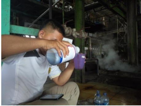
Gambar 1. Menakar triklopir dengan gelas ukur