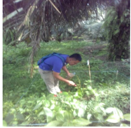
Gambar 5. Oles pada Gulma