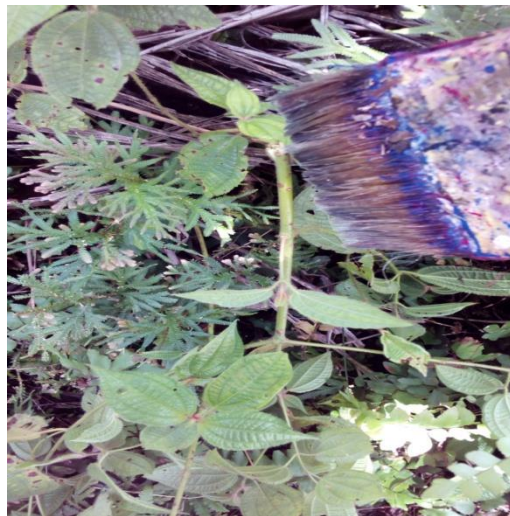
Gambar 6. Batang Pada Gulma Dioles