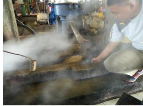
Gambar 2. Pengambilan Limbah