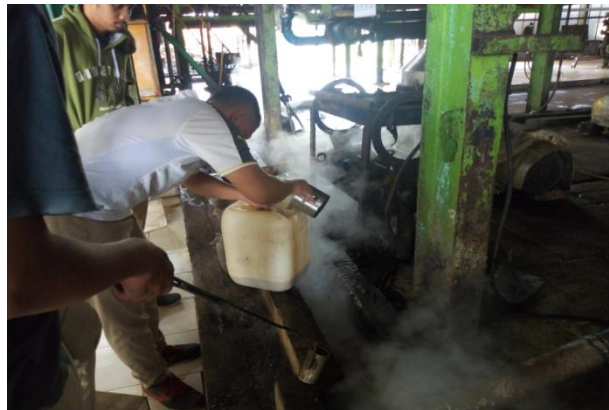
Gambar 3. Triklopir dan LCPKS dicampurkan didalam derigen